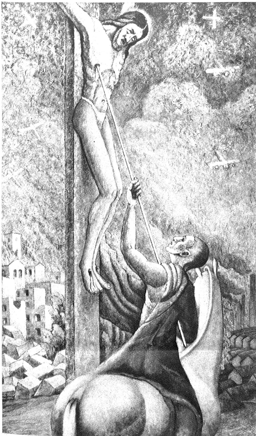
Irrtum (Christus-Idee zerstören, wird immer Krieg heraufbeschwören)