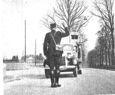
Anhalten bitte, Fahrzeugkontrolle!