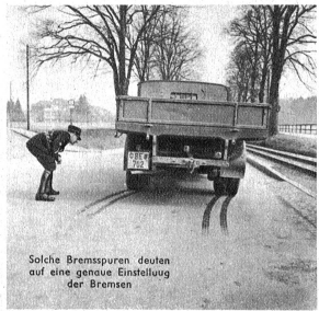
Solche Bremsspuren deuten auf eine genaue Einstellung der Bremsen

Ausrüstung, sah man auch zwei Radfahrer, die sich beim Erblicken der Kontrolle durch die Flucht derselben entziehen wollten. Für Ausreisser hat die Polizei aber besonders scharfe Augen. Sie wurden mit- teils eines Dienstmotorrades eingeholt und zur Kontrolle zurückgeführt. Auch hier ergab diese, dass sich die Fahrräder nicht in hehrbetriebsicherem Zustande befanden. Sämtliche Mängel der beanstandeten Fahrzeuge wurden in ein besonderes Kontrollbuch eingetragen. Ein Doppel wurde dem Fahrer übergeben mit der Aufforderung, das Fahrzeug innert festgesetzter Frist instandstellen zu lassen und es dem Polizeiposten des Wohnorts zur Nachkontrolle vorzuführen. Zudem hat er in jedem Falle noch eine Busse zu gewärtigen. — Man konnte sich bei dieser Kontrolle über-