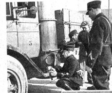
Bremskontrolle. Anbringen des Bremsprüfapparates