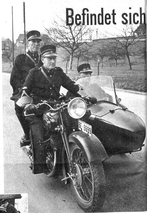
Fahrt zur Kontrolle

Unten: Zwecks Einsparung von Gummireifen für Motorfahrzeuge wurden besondere Vorschriften über Geschwindigkeit, Gesamtgewicht und Pneuendruck erlassen. Motorfahrzeuge dürfen demnach nur verkehren, wenn ihre Reifen richtig aufgepumpt sind