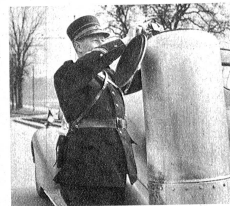
Kontrolle, ob der Generator auch wirklich im Betrieb ist. Um sicher zu sein, werden die Gase mit einem Streichholz zur Explosion gebracht