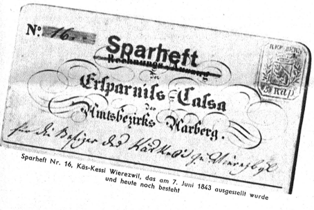
Sparheft Nr. 16, Kas-Kessi Wierzewski, das am 7. Juni 1843 ausgestellt wurde und heute noch besteht

anlasse den Kassier, entgegen aller Uebung, einen eingehenden Vorbericht zur Jahresrechnung zu verfassen, dem zu entnehmen ist, dass der Verlust ganze 113 Franken und 59 Rappen betragen hat, wogegen die Jubilaren damals schon ein Reilvermögen von Fr. 25 335.07 besaßen. Als weiterer Schritt der Entwicklung gilt die Umwandlung der Amtersparnkasse in eine Genossenschaft. Innerlich in jeder Hinsicht gestützt trat die Amtersparnkasse Aarberg mit der konstituierenden Generalversammlung vom 4. Dezember 1887 nunmehr in der Rechtsform der Genossenschaft vor ihre treuen Kunden und Anhänger. Nach weiteren 16 Jahren unermüdlicher Arbeit wurde ein eigenes Kaasgebäude im Städtchen Aarberg errichtet, in dem am 30. Dezember 1904 die erste Vorstandssitzung stattfand. In diese Zeit fällt auch die Gründung der Filiale in