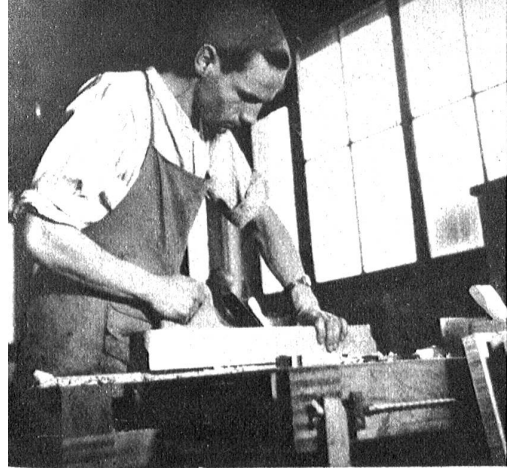
In der Schreinerei wird das Holz zugerichtet