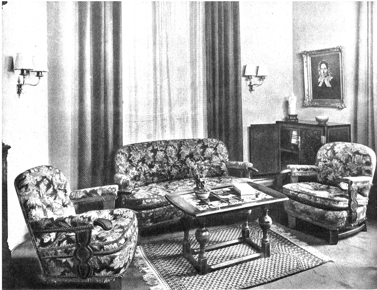
Sitzmöbel-Arrangement des vorstehenden Esszimmers in Nussbaum, mit geblumtem Wollgobelin-Bezug. Tisch mit handbemalten Keramik-Kacheln. Entwurf und Ausführung: Meer & Cie AG Bern

Ihr Heim wird nun durch die so entstandenen Möbelstücke zur angenehmen Wirklichkeit. Jedes Möbel mag in gewissen Herstellungs-Phasen einer maschinellen Bearbeitung unterliegen, im Prinzip aber wird seine Fertigstellung durch individuelle Handarbeit beendet. Die Maschine ist nicht entscheidend, sie ist das arbeitsleichternde Hilfsmittel unserer Zeit, welche es dem qualifizierten Handwerker ermöglicht, seine wertvollsten, manuellen Fertigkeiten dem entscheidenden Zusammenbau und einer feinen Finissage zuzuwenden. Gut geschulte und erfahrene Schreiner, Fertigmacher und Polsterer, unter entsprechender Werkleitung sind die wichtigste Voraussetzung eines kultivierten Handwerkes. Die gleichen Prinzipien, welche den Kunsthandwerker früherer Epochen beseelten, werden auch heute noch respektiert und vermitteln einem gepflegten Heim jene überpersönliche Note, die an keinen Zeitgeist mehr gebunden ist.