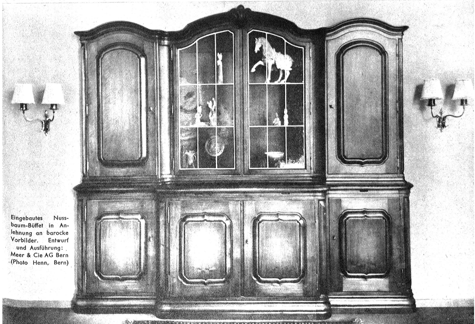
Eingebautes Nuss- baum-Büffet in An- lehnung an barocke Vorbilder. Entwurf und Ausführung: Meer & Cie AG Bern

Gestaltet sich schon im Arbeitsbeginn das geplante Objekt, so muss hervorgehoben werden, dass man die Wahl des Holzes in bezug auf Qualität und Lagerungszeit ganz besonders sorgfältig trifft. In der Schreinerei wird nun dasselbe nach fachtechnischen Erwägungen zugeschnitten, gehobelt, geleimt, gegen jedes Verziehen abgesperrt und dem Zusammenbau zugeführt, wonach das geplante Möbelstück in fachlich gesonderten, handwerklichen Arbeitsgängen entsteht.