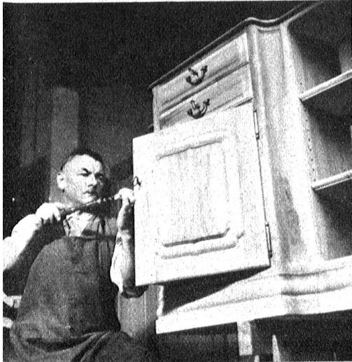
Das Möbel im Bild nebenan beim Zusammenbau

Gestaltet sich schon im Arbeitsbeginn das geplante Objekt, so muss hervorgehoben werden, dass man die Wahl des Holzes in bezug auf Qualität und Lagerungszeit ganz besonders sorgfältig trifft. In der Schreinerei wird nun dasselbe nach fachtechnischen Erwägungen zugeschnitten, gehobelt, geleimt, gegen jedes Verziehen abgesperrt und dem Zusammenbau zugeführt, wonach das geplante Möbelstück in fachlich gesonderten, handwerklichen Arbeitsgängen entsteht.