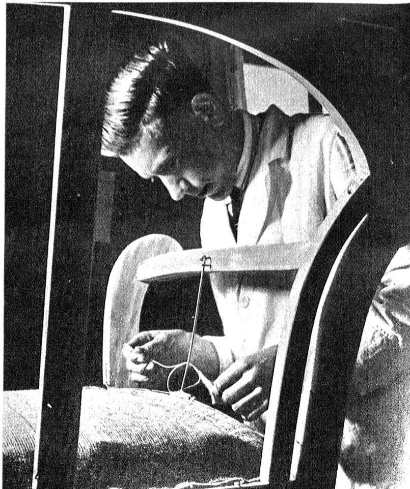
Detail aus den Polsterwerkstätten des Hauses

Ihr Heim wird nun durch die so entstandenen Möbelstücke zur angenehmen Wirklichkeit. Jedes Möbel mag in gewissen Herstellungs-Phasen einer maschinellen Bearbeitung unterliegen, im Prinzip aber wird seine Fertigstellung durch individuelle Handarbeit beendet. Die Maschine ist nicht entscheidend, sie ist das arbeitsleichternde Hilfsmittel unserer Zeit, welche es dem qualifizierten Handwerker ermöglicht, seine wertvollsten, manuellen Fertigkeiten dem entscheidenden Zusammenbau und einer feinen Finissage zuzuwenden. Gut geschulte und erfahrene Schreiner, Fertigmacher und Polsterer, unter entsprechender Werkleitung sind die wichtigste Voraussetzung eines kultivierten Handwerkes. Die gleichen Prinzipien, welche den Kunsthandwerker früherer Epochen beseelten, werden auch heute noch respektiert und vermitteln einem gepflegten Heim jene überpersönliche Note, die an keinen Zeitgeist mehr gebunden ist.