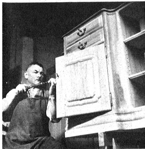
Das Möbel im Bild nebenan beim Zusammenbau

Gestaltet sich schon im Arbeitsbeginn das geplante Objekt, so muss hervorgehoben werden, dass man die Wahl des Holzes in bezug auf Qualität und Lagerungszeit ganz besonders sorgfältig trifft. In der Schreinerei wird nun dasselbe nach fachtechnischen Erwägungen zugeschnitten, gehobelt, geleimt, gegen jedes Verziehen abgesperrt und dem Zusammenbau zugeführt, wonach das geplante Möbelstück in fachlich gesonderten, handwerklichen Arbeitsgängen entsteht.