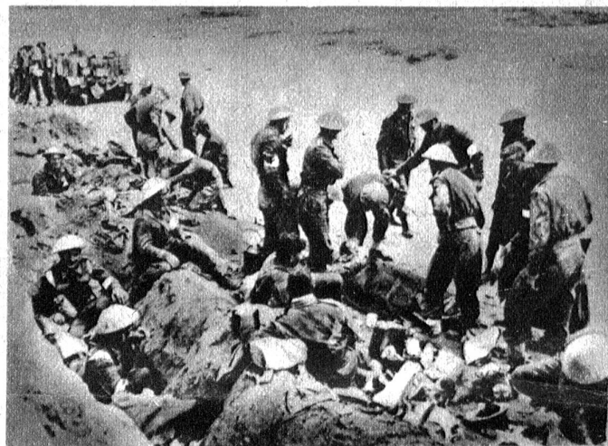
Britische Infanteristen der 8. Armee werden in einer Gefechtspause von Sanitätsmannschaften gepflegt.

Nun wendet sich die polnische Regierung an das «Rote Kreuz» und bittet um unverzügliche Untersuchungen im Walde von Katyn. Berlin gibt bekannt, dass polnische kriegsgefangene Offiziere Gelegenheit bekommen hätten, selbst bei der Freilegung ihrer gemordeten Kameraden zugegen zu sein. Entwickelt sich die Angelegenheit weiter wie bisher, dann kann daraus für Stalin ein bedenkliches Menetekel werden. Natürlich muss man abwarten, was die Rot-Kreuz-Leute finden. Und auch dies und jenes An-