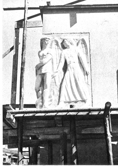
Das neue Relief am Feuerwehrgebäude, den Florian und seinen Engel darstellend.