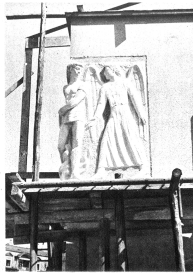
Das neue Relief am Feuerwehrgebäude, den Florian und seinen Engel darstellend.