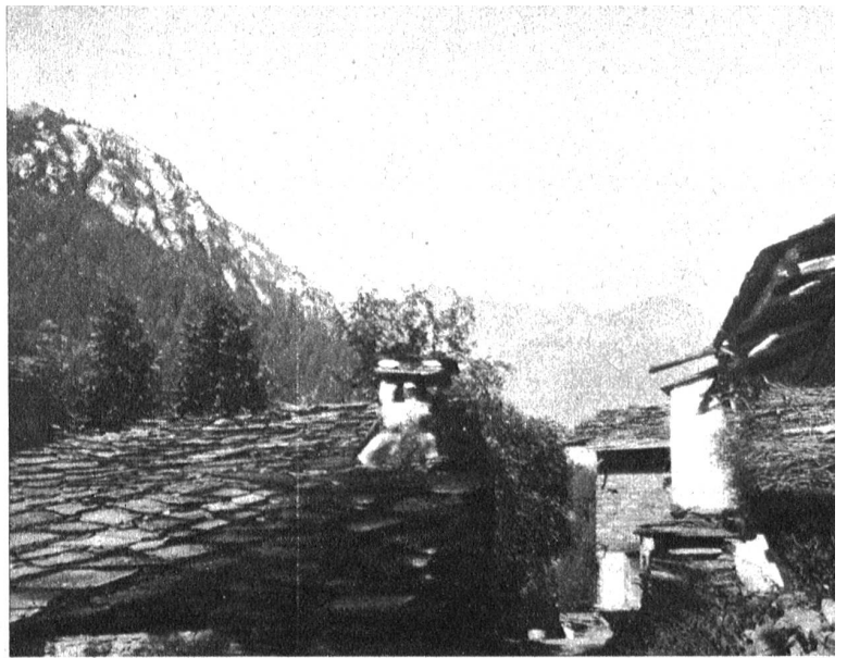
Italienische Romantik am Weg zum Monte Viso

Wir hatten die Absicht gehabt, baldmöglichst nach Susa, am Fusse des Mont Cenis, und von da nach Turin weiterzufahren und sahen uns daher mächtig enttäuscht, als man uns mitteilte, der italienische Autokurs verlasse die Passhöhe erst nach 5 Uhr abends. In unserem geheimen Aerger liessen wir uns verleiten, uns im Albergo della Posta zum Mittagessen niederzulassen. Wir sollten das Rechte getan haben. Ob des italienischen Hors d'œuvres, den Ravigio's und den prächtigen Forellen aus dem Passsee hellten sich die Mienen unserer kleinen Gesellschaft bald auf, gleich einer Landschaft, nach dem Gewitter. Der vorzügliche Landwein tat das übrige. Am Nachbarische hatten sich vier geistliche Herren niedergelassen und bewiesen, dass die hohe Geistlichkeit kulinarischen Genüssen noch immer nicht abhold ist. Als jedoch einer von uns bemerkte, sie hätten sich beim Lesen der Rechnung bekreuzigt, sank unser Behaglichkeitsbarometer ganz bedeutend; denn unser Lirebestand war trotz des niederen Kurses nicht allzumächtig. Die «Addition» kam und machte denn auch tatsächlich ein nicht unbeträchtliches Loch in den wohlbehüteten Liresack. Vergleich man sie