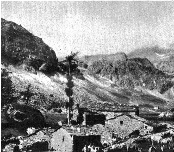
Am Weg zur Sellahütte

Die Kette fällt und jetzt geht's leicht abwärts. Rechts und links weichen die Strassenböschungen, die Enge öffnet sich zur weiten Fläche der Passhöhe. Dunkelblau blinkt ein grosser See, umgeben von Grün, und nach ein paar Kehren hält der Wagen vor einer grauen Häuserfront: Albergo della Posta, Albergo del Lago usw.