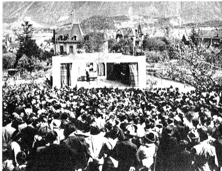
Rechts: Inmitten des pracht-vollen Rhonefrühlings, nahe der Sprachgrenze hat die Dorfjugend von Muraz-Veyras auf einer Freilichtbühne C. F. Ramaz's „Sonderung der Rassen“ aufgeführt und damit einen einzigartigen Beitrag zur schweiz. Dilet-tanten-Dramatik geliefert