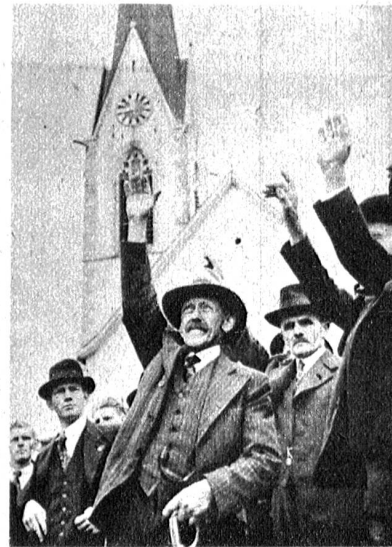
Rechts: Gegen 10 000 mit dem Degen bewehrte Bürger nahmen an der Landsgemeinde von Appenzell - Ausserrhoden auf dem Dorfplatz Hundwil teil. Ueberaus bewegt waren die Ersatzwahlen in die Regierung