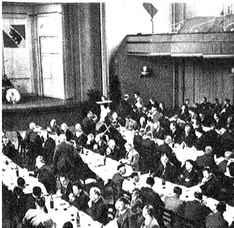
Während dem Bankett wurden verschiedene Darbietungen gehalten

Gewaltigen Widerhall fanden seine Ausführungen über die Gewerbepolitik. Das Gewerbe verfolgt in der Ausführung seines Berufes die Erreichung der Selbsterhaltung und nicht das kapitalistische Profitstreben, und so ist nach dem Krieg ein vermehrter