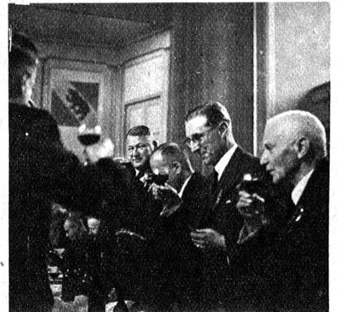
Prominente Gäste beim Bankett

Der Referent kam dann auf die Arbeitsbeschaffung und Submissionspraxis zu sprechen und betonte, dass eine Zusammenarbeit des Gewerbes mit der Kriegswirtschaft notwendig ist. Nationalrat Gysler