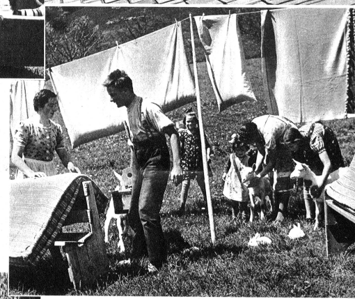
Die ganz Kleinen kommen sich ziemlich verlassen vor und suchen Trost bei den Tieren.

Alljährlich im Frühling sieht man die Simmentaler ihre Häuser innen und aussen blitzblank putzen. Die ganze Familie legt Hand an, die Mutter und die Töchter reinigen die Fussböden, putzen die Fenster, klopfen das Bettzeug auf den Wiesen auf, während die Söhne mit dem Vater auf ein zu Reinigungszwecken rasch hergestelltes und montiertes Gerüst klettern, um das Haus von aussen gründlich und sauber abzuwaschen. Von einer solchen Frühjahrsputzzeit, die zur Tradition der Simmentaler gehört, berichten wir heute in Bild und Wort.