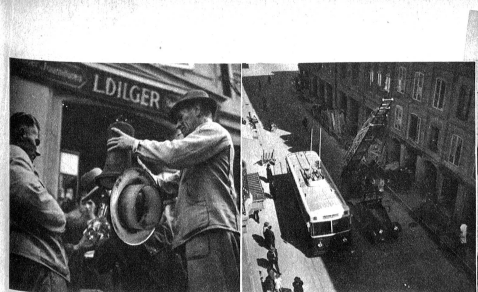
Links: Heikle Arbeit mit zerbrechlichem Glas und stechenden Insekten. • Mitte: Beinahe Verkehrshindernis wäre der Feuerwehrwagen geworden, hätte die Polizei nicht für Ordnung gesorgt. • Ein Bienenschwarm hat die nicht sehr angenehme Eigenschaft, sich aufzulösen, wenn man ihn stört. Das haben auch die beiden auf der Leiter gemerkt, als sie ihn einfangen wollten

FERIEN! Noch schöner mit dem illustrierten Reisehandbuch DIE SCHWEIZ . Verlangen Sie Ihr Exemplar zum Vorzugspreis von Fr. 4.50 beim Buchverlag Verbandsdruckerei AG Bern