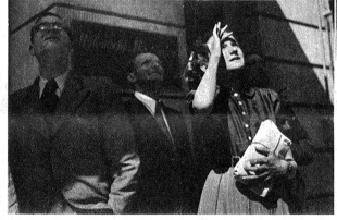
Das haben sie noch nie gesehen; das kleine, gewiss nicht alltägliche Insektarium an der Schauplatzasse war für viele einmalig in seiner Art