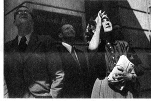
Das haben sie noch nie gesehen; das kleine, gewiss nicht alltägliche Insektarium an der Schauplatzasse war für viele einmalig in seiner Art