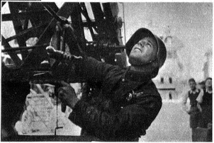
Bienenschwarm als Reiseziel auserkoren. Dass es kein Leichtes war, die Ausreisser wieder einzufangen, veranschaulichen unsere Bilder. Nachdem die Feuerwehr mit einem Leiterwagen angezurückt war, stieg ein linker