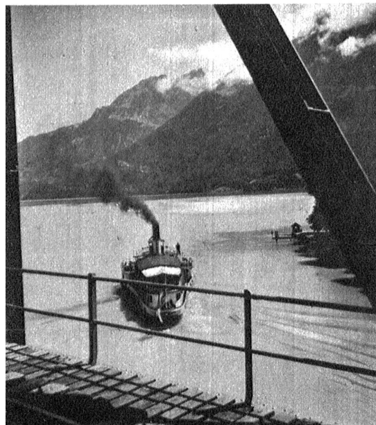
Blick von der Eisenbahnbrücke bei Interlaken seeaufwärts Rechts: Die alte Kirche von Brienz