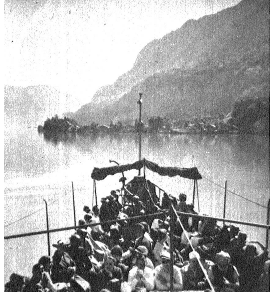
Iseltwald, das Idyll am Brienersee (Nr. 7473 BRB 3. 10. 39)

Ein solches reizvolles Bergidyll ist auch der Brienersee. Seine Ufer sind voller Abwechslung. Auf der rechten Seeseite ein Kranz freundlicher Ortschaften mit bodenständiger, lieber Bevölkerung, auf der linken jedoch unberührte Natur, rauschende Wasserfälle und das liebliche Eiland Iseltwald. Schöne Aussichtsberge bieten zahlreiche Tourenmöglichkeiten, die weite Seefläche erlaubt jeden Wassersport, während zahlreiche Badeplätze zu kühlem Bade einladen ... ein wirkliches Ferienparadies.