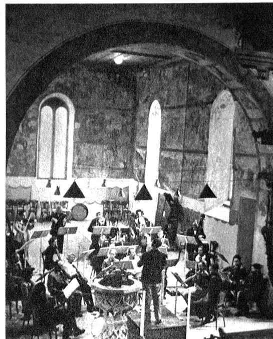
Das Stadtorchester Winterthur spielt unter Dr. H. Scherchens Leitung in der alten Kirche zu Saanen