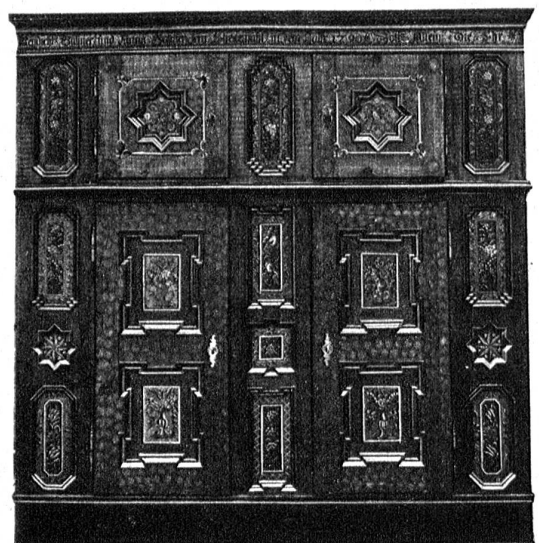
Rechts: Derselbe nach der Restaurierung