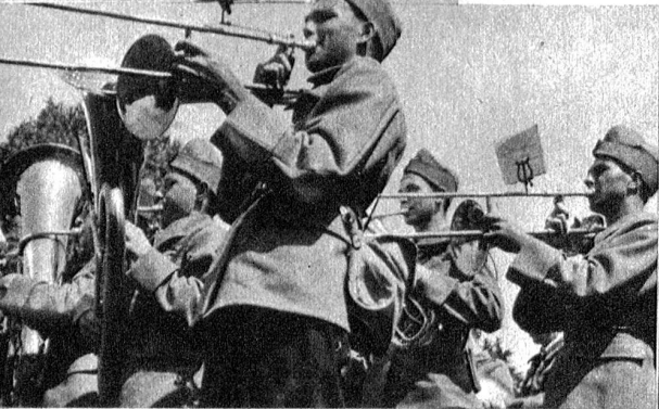
Abmarsch mit klingendem Bataillonsspiel Rechts: Bataillonskommandant bei der Befehlsausgabe Unten: Wettkampf im Kleinkaliber-Schiessen Unten rechts: Mittagsbiwak und Verpflegung