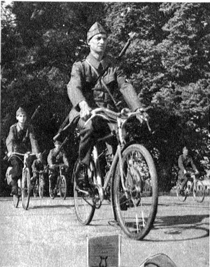
Abmarsch zur Vereidigung