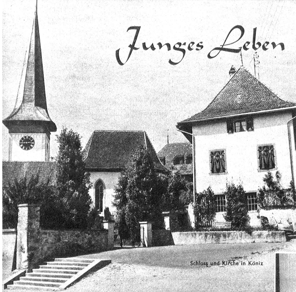
Schloss und Kirche in Köniz

Wenn dann die Töchter nach zwei Jahren das Heim verlassen, dann gibt es nicht selten neue Schwierigkeiten. So fällt es ihnen meist nicht leicht, sich