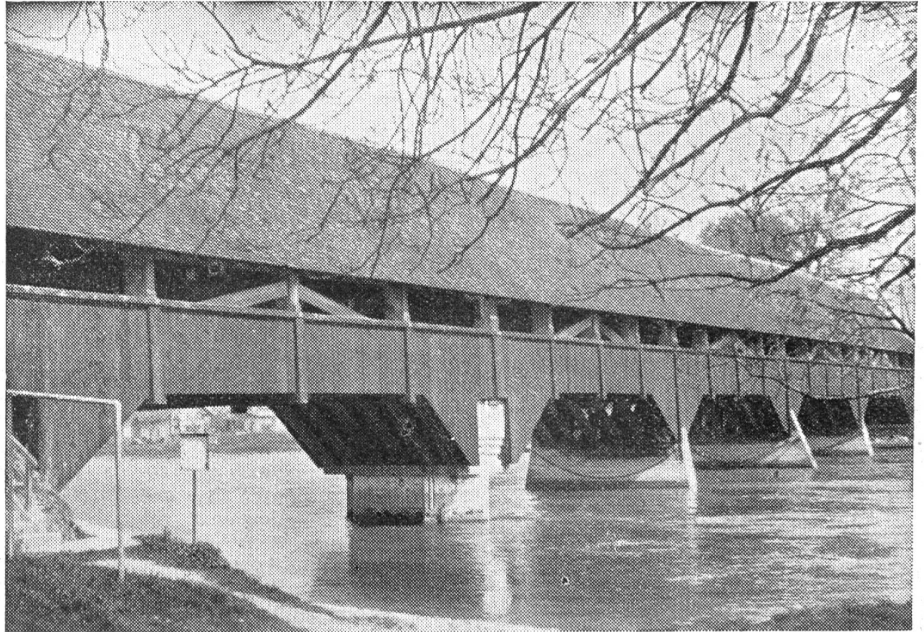
Die im Jahre 1576 erbaute Brücke von Wangen a. A.

der alten Brattig, was einer eintrug, der Schweres erlebt und die Namen in der Bibel im Gänterli! Und vergleiche, was der Bube sagt, der doch weder schreiben noch lesen kann.“