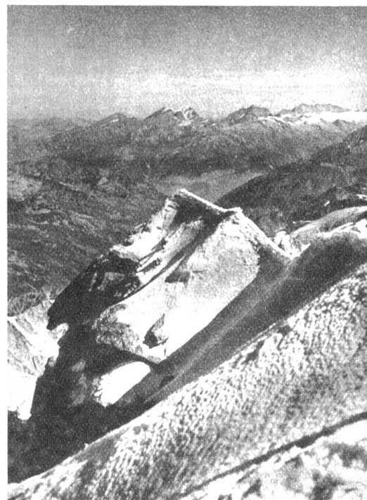
Der oberste Teil des Weisshorn-Nordgrates und Blick auf die Berner Alpen

ihnen auch die Nebel verzogen und die Berge strahlten im hellsten Sonnenglanze. Zwar pfiiff ein recht scharfer Wind um die Grate, so dass wir uns auf dem Gipfel ganz gerne an einen geschützten Ort verzogen. Dennoch beeilten wir uns nicht besonders und genossen zunächst die prachtvolle, weite Sicht ins Herz des Walliser Hochgebirges in vollen Zügen, um dann gemächlich die vielen Türme zum Nadelhorn und