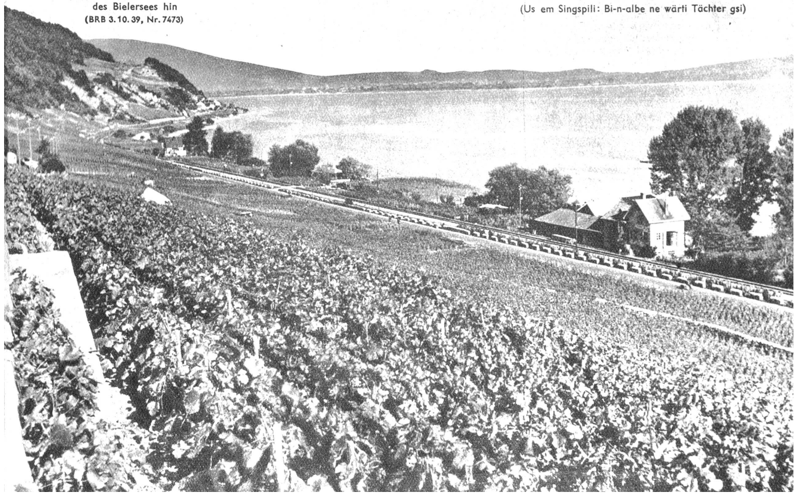
Ausgedehnte Rebgeleände ziehen sich am linken Ufer des Bielersees hin (BRB 3.10.39, Nr. 7473)

(Us em Singspili: Bi-n-albe ne wärti Tächter gsi)