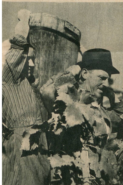
Schwer ist die Last des vollen Gefässes, das nun zur Presse gebracht werden muss

Als hoch in den Reben die schöne Ligerzer Kirche erbaut war und die Reformation so manchen alten Gnadenort unnötig werden liess, wurde, wie bereits gesagt, die aus dem 14. Jahrhundert stammende Kapelle am See unten profaniert; dieser Gnadenort war der hl. Anna geweiht gewesen; er war wohl, wie so viele andere Kapellen an den Strassen und Wegen, ursprünglich der Standort eines Kreuzes, «hässlichs Chritz», wie sie seit den Kreuzzügen bei uns so häufig errichtet wurden, um das Volk auf Schritt und Tritt an das Leiden und Sterben Christi zu erinnern. Später