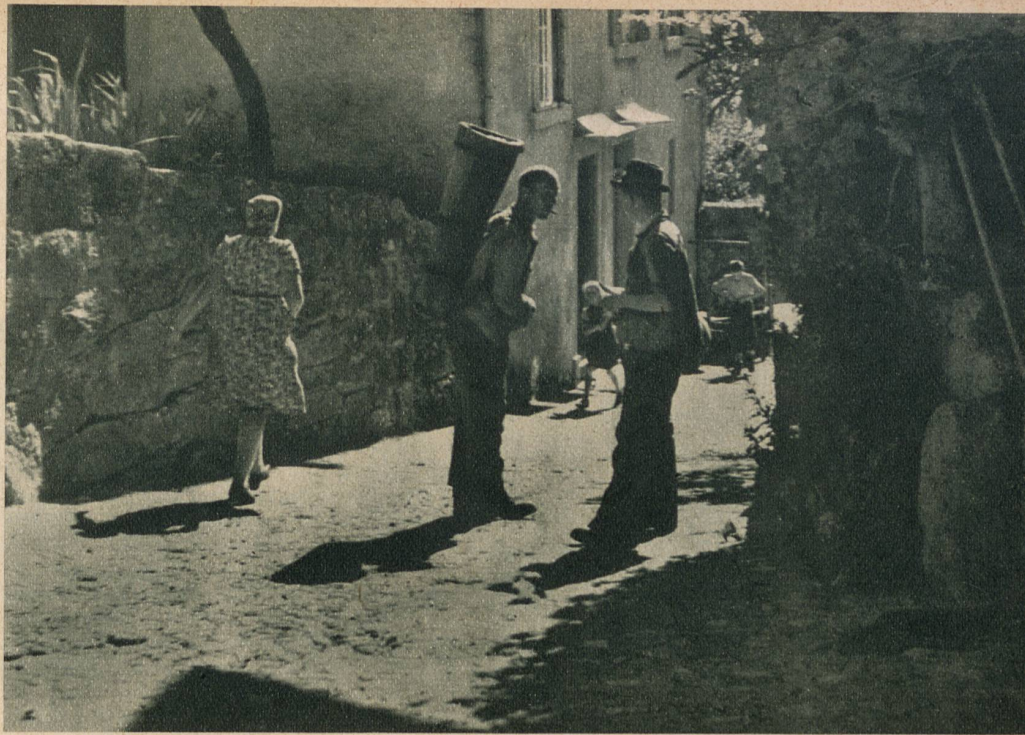
Einer, der sich nach dem Resultat der Ernte erkundigt

Die Weinbauern sind sehr einfache und bescheidene Leute, die sehr hart arbeiten müssen, um ihren Lebensunterhalt zu verdienen. Sie sind aber so eng mit ihrem Rebberg verbunden, dass sie zufrieden sind mit ihrem Schicksal, und schliesslich kommt es doch nur darauf an, wie einer einmal trägt, was er zu tragen hat. In der Zwischenzeit betreiben die Winzer meistens noch Fischerei, und so haben diese Dörfchen ein ganz eigenes Gepräge erhalten, es sind malerische, originelle, für sich abgeschlossene Strassenbilder, die irgendwie an ein südliches Motiv erinnern, seien es die ruhigen