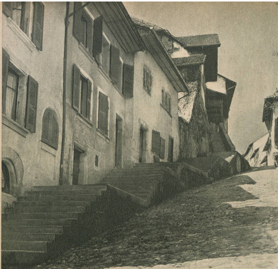
An diesen malerischen Häusern vorbei steigt man zum Schloss Erlach empor

zen nicht zu Ausfuhr- und Schwarzhandelszwecken angekauft worden! Aber ob dieses Verbots erzürnte sich der Fürst von Neuenburg; das war kein Geringerer als der Alte Fritz von Preussen; und dieses Erzürnen war auch nicht ganz unangebracht; denn sonst war das Brot für das Ländchen Neuenburg immer im Seeland gewachsen. Und da ging nun die Mär, der Alte Fritz habe seinen Staatsrat beauftragt, zu untersuchen, auf welche Weise seinerzeit das Seeland an Bern gekommen sei; mit andern Worten: einen glaubhaften Vorwand zu finden, um den bösen Bernern besagtes Seeland wegzunehmen. Das empfand man in Bern schon deswegen nicht nett, weil gerade Bern sich seinerzeit nachdrücklich dafür eingesetzt hatte, dass Neuenburg an Preussen komme. Gottlob: die dicke Luft verzog sich rasch; aufatmend vernahm man, die schlimme Kunde sei ein blosses Gerücht gewesen.