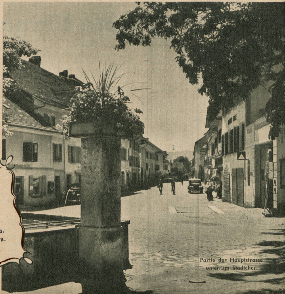
Partie der Hauptstrasse unten im Städtchen

Von Erlach gehe auf keinen Fall und unter keinem Vorwande wieder weg, ohne seinen Wein gekostet zu haben. An Gaststätten, wo man ihn zu hegen und zu kredenzen weiss, mangelt es drunten an der Hauptgasse und auch anderswo im Städtli nicht. Er verträgt sich übrigens ausgezeichnet mit irgendeinem schmackhaften Seefisch. Und sollte dir gar das auserwählte Los zufallen, am Paulitag... aber, ach nein, es tut mir leid, da kommst du und da komme ich nicht hin. Um mitmachen zu dürfen, wenn am Paulitag und Pauliabend, alljährlich einmal, Städtliwein, kerniges Brot und Hammeschnittli bei munterem Geplauder kreisen, dazu muss man... Erlacher Burger sein. C. L.