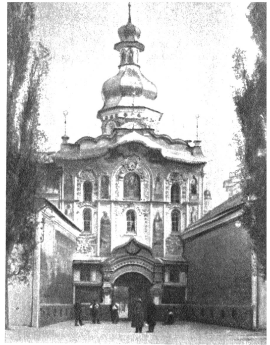
Kiew, Eingang zum Höhlenkloster

Die Festung Kiew wurde unter Peter dem Grossen begonnen und später in modernem Stile ausgebaut. J.