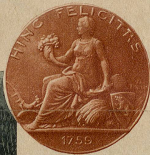
Kreis: Die von der Oekonomischen und Gemeinnützigen Gesellschaft gestifteten Silbermedaillen als Extrapreise