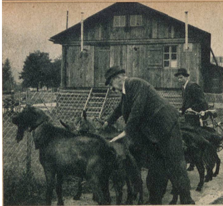
Bevor die Tiere zur Ausstellung zugelassen werden, untersucht sie der Platzarzt auf ihren Gesundheitszustand