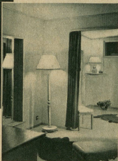
Das Licht spielt in der Auswahl der entsprechenden Modelle eine sehr wichtige Rolle und deshalb schuf der Architekt die Möglichkeit, dass auch die notwendige, einfache Lichtquelle — die Lampe — richtig in den ganzen Rahmen eingereiht wird.