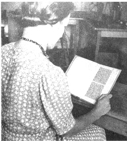
Prüfung des Farbensinnes ist für alle Berufe, die irgendwie mit Farben zu arbeiten haben, wichtig. Denken wir zum Beispiel nur an den Fall eines Lokomotivführers, der ein rotes Signal von einem grünen unterscheiden können muss, wieviel hängt da vom Farbensinn ab