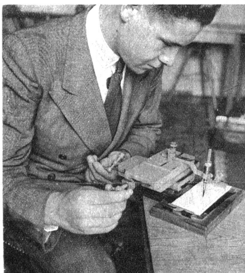
Besonders bei allen mechanischen Berufen spielt die Fertigkeit der Hand eine wesentliche Rolle. Hier wird, ähnlich wie bei einer Drehbank, am Zweihandprüfer die Fertigkeit erprobt