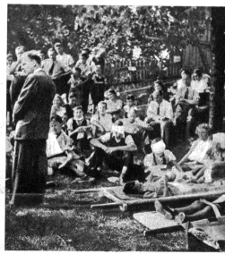
Vor der Einfahrt des Bauernhauses werden die Verletzten ins Freie verbracht

ou vil Volch häre zoge u gwünd alli het mit e me dankbare Gfueh dra milesee dänke, wie gut es doch isch, dass das alle nume en Uebig u nid Aornachfall isch, dass mir no Friede het. Aber gwünd jodes het ou gseh, wie wärtvoll u nötig d'Arbeit vom Rote Chrütz isch u grad im Chrieg u dass me se soll u muess unterstütze, jedes nach sim beschte Chöme.