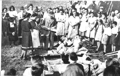
Rechts: Ein besonders schwieriger Fall wird eingehend besprochen