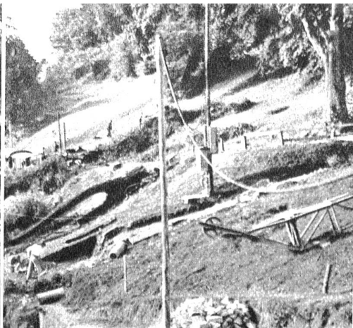
Der alte „Schlängeler“ verschwindet