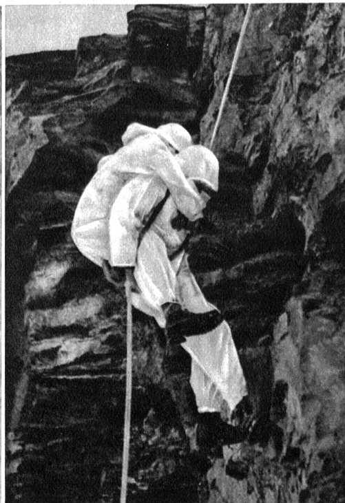
Kameradschaftsdienst in den Bergen Zens. No. F 1/1371

Hinterland einzustehen, verleiht ihm Kraft und Ausdauer. So bescheiden die Soldatenpäcklein auch ausfallen werden, erfordern sie doch ganz beträchtliche Geldmittel. Dieselben sollen durch eine besondere Aktion sichergestellt werden. Geplant ist der Vertrieb einer gediegenen Stecknadel (Soldatenkopf) auf Rockrevers, Bluse oder Krawatte. Am 11. und 12. Dezember werden diese Nadeln in der ganzen Schweiz zum Preise von Fr. 1.— im Strassenverkauf angeboten. Ueber eine Million Abzeichen sind in Fabrikation gegeben worden. Es ist zu hoffen, dass das letzte Stück einen Abnehmer finden wird. Wer darüber hinaus noch ein mehreres geben möchte, findet Gelegenheit, seinen Beitrag auf Postcheckkonto III/7017 einzuzahlen.