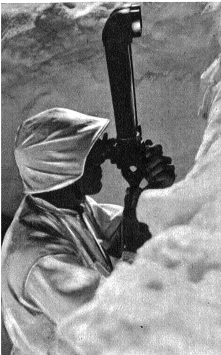
Auf dem Beobachtungsposten im Schnee Zens. Nr. F 1/1485