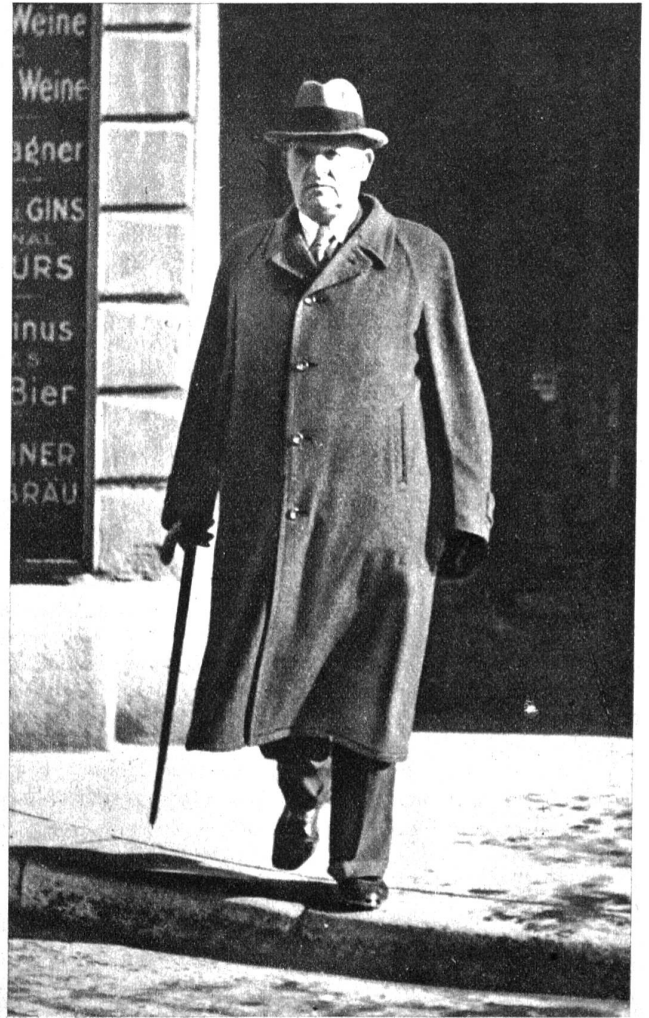
Rechts: Der Bundespräsident für 1944, Bundesrat Dr. Walter Stampfli, auf dem Heimweg

von Sohn, der dafür Heimarrest haben sollte, um sich aufs Gymnasium vorzubereiten. Aber, weisst ja, Kamerad, wenn man als Vagant geboren wurde, altes Soldatenblut in den Adern hat..., mein Grossonkel führte das Regiment von Wattenwyl in England drüben..., da heisst rasten — rosten! Und drum bin ich ausgezogen, wieder einmal auf eigne Faust Mutter Helvetia in die Falten und Runzeln zu gucken, oder vielmehr, ihre ewigjunge Natur, die Haller wundervoll besang, zu bewundern. Verhüllt sie nun extra mir zur Strafe das Wytenalphorn mit siebenfachen grauen, nassen Schleiern, was meinst, Kamerad? "