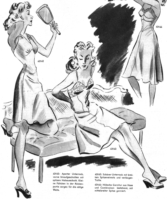
43142: Aparter Unterrock, vorne hinaufgeschnitten mit spitzem Halsausschnitt. Kleine Fällchen in der Rückenpartie sorgen für die nötige Weite.