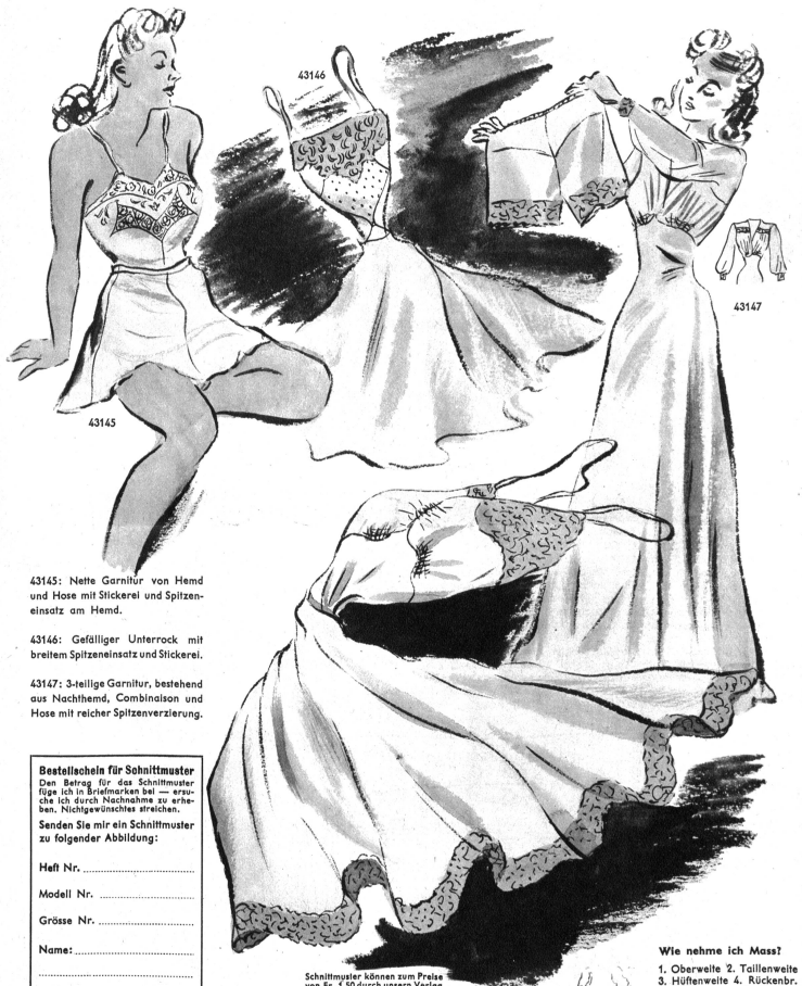
43145: Netze Garnitur von Hemd und Hose mit Stickerei und Spitzeneinsatz am Hemd.