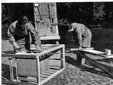
So entstehen Tische, Stühle und Betten für kleine Kinder. Ein leicht transportabler Kasten enthält hierzu die nötigen Werkzeuge

Er ist eine Abteilung des zivilen FHD, bereit zu praktischer Hilfeleistung. Vielen Frauen wurde es klar, als man seinerzeit vom Evakuieren sprach und vom Elend der flüchtenden Zivilpersonen hörte, wie ausserordentlich wichtig ein gut vorbereiteter Hilfstrupp wäre. In aller Stille haben die Zürcher Frauen mit der dazu notwendigen Ausbildung begonnen. Sie lernen Notlager, Notunterkünfte, Notkochstellen errichten, Karten lesen, bilden den Orientierungssinn und das Gedächtnis aus und üben sich im Ueberbringen von Meldungen. Denken wir, wie wichtig solche Kenntnisse in einem Ernstfall wären! In Kriegs- und Notzeiten, bei jeder Katastrophe, kann der Hilfstrupp zur ersten Hilfeleistung heran-