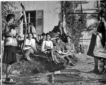
Signalisieren wird geübt, die einzige Möglichkeit der Verständigung, wenn alle Verbindungen abgeschnitten sind