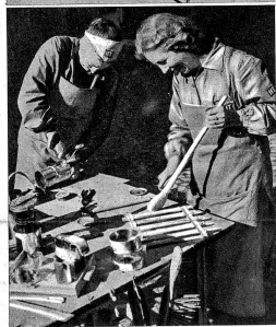
Zur Beschäftigung und Ablenkung der Kinder in gefährlichen Momenten werden Spielsachen aus den einfachsten Materialien hergestellt