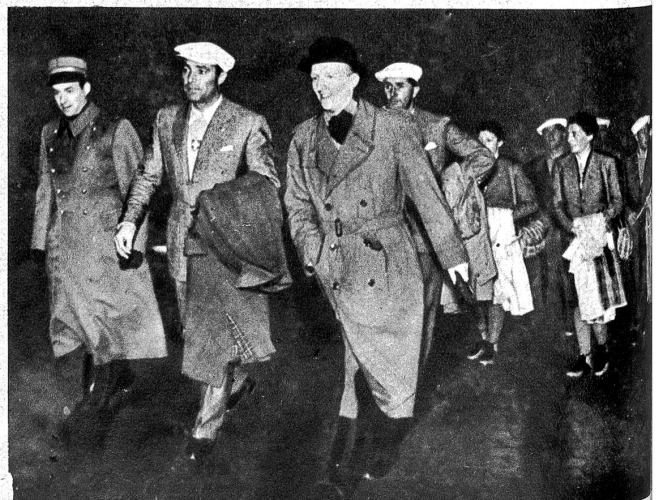
Ankunft der Schweizermannschaft für den Skiwettkampf Schweden-Schweiz in Stockholm, wo sie begeistert empfangen wurde.

Als dann am 4. Februar die Siegesmeldung aus Moskau kam, war die entscheidende Aktion der beiden russischen Armeen schon gelungen. Das heisst: Watutins Ostflügel hatte die ganze Westflanke eingedrückt und zugleich den Raum bis südlich von Swenigorodka erobert. Konjews Nordflügel war auf der ganzen «Ingulfront» im Nordwesten von Kirowograd bis nördlich von Smjela über die östliche Flankensicherung vorgebrochen und erkämpfte nördlich von Schpol die Verbindung mit Watutin. Das eingekreiste Gebiet umfasste ein Viereck von mehr als 30 km Seitenlänge. Dem russischen Ansturm fielen Mironowka, Boguslaw und Kanjew im Westen, Zwetskowo ,