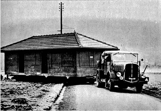
Wenn der Baumeister die Schölle betrifft, so muss der Pflanzler weichen. Aus diesem Grunde wurde letzte Woche das 10 m lange Pflanzhaus der Firma Dr. Wander AG. vom Liebefeld nach dem neuen Areal im Steinhölzli transportiert

lungen gelingen könnten. Dass sie zunächst lokale, dann weiter führende Durchbrüche erzwingen und mit dem Sinken der Waage zu ihren Gunsten auch grössere und zuletzt ähnlich grosse Gefangenenmassen einbringen müssten. Und wenn die ersten Wochen des deutschen Angriffes im Blitztempo vor sich gingen, würden die Russen in den letzten dieses Tempo erreichen. Das sind nicht einfache «Prophezeiungen», sondern Ergebnisse logischer Ueberlegungen.