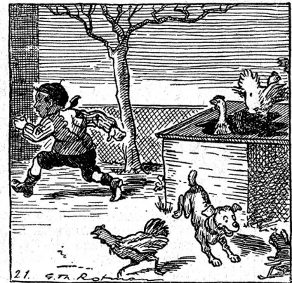
21. Nicht ohne Mühe wusste Hans sich endlich durch das Loch emporzuarbeiten. Er sprang zu Boden und rannte davon, während Bello den Hühnern, die laut gackernd aus dem Loch herauskamen, nachsetzte. Bald war nicht ein einziges Huhn mehr zu entdecken, sie waren alle in die benachbarten Gärten geflüchtet. Jetzt rannte Bello dem Hans wieder nach, der schon wieder in der Küche angekommen war, wo Peter noch immer hing.