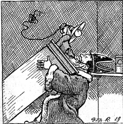
19. Während dieser Zeit hatte Hans versucht, Bello mit dem Feuerhaken zu treffen, mit dem Ergebnis, dass er nun selber angegriffen wurde. Gellend flüchtete er zum Fenster hinaus. Peter, der dort in der Einsamkeit hängen blieb, unternahm allerhand verzweifelte Versuche, sich zu befreien. Er versuchte es dadurch, dass er sich an der Küchenlampe aufziehen wollte, ohne aber ein anderes Ergebnis zu erzielen, als dass er die ganze Lampe aus der Decke herauszog.

von G. Th. Rotman (Nachdruck verboten) 3. Fortsetzung