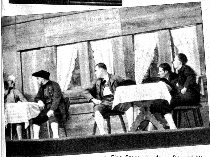
Eine Szene aus dem „Bärestübli“