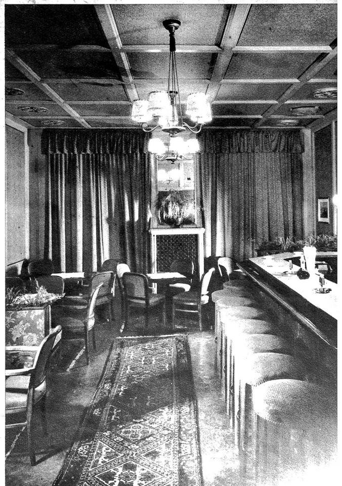
Teilansicht der Bürgerhausstube mit der charakteristischen Tiefe