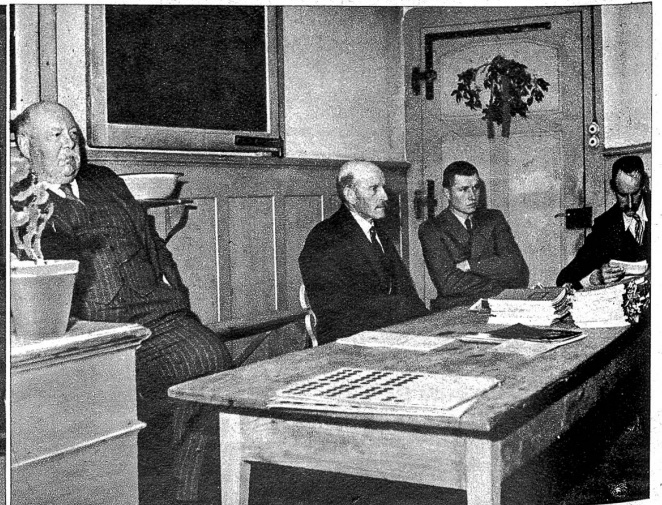
Die Schulkommission und Eltern sind aufmerksame Zuhörer während des Examins