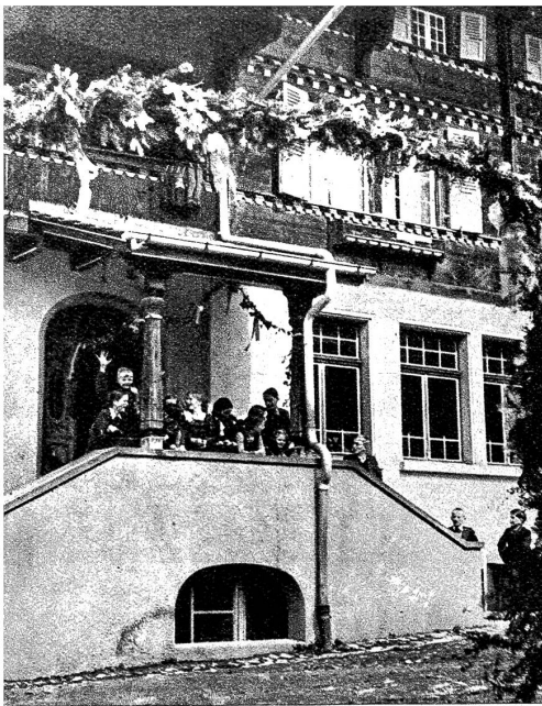
Das Schulhaus wurde zu Ehren des Tages bekränzt