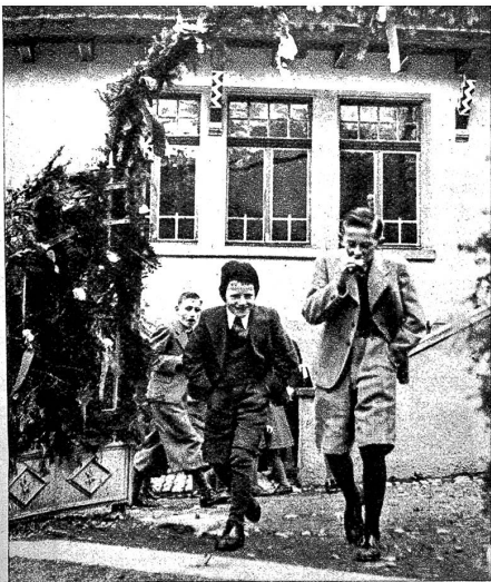
Unbeschwert von Sorgen stürmen die Knaben nachher aus der Schule ins Leben