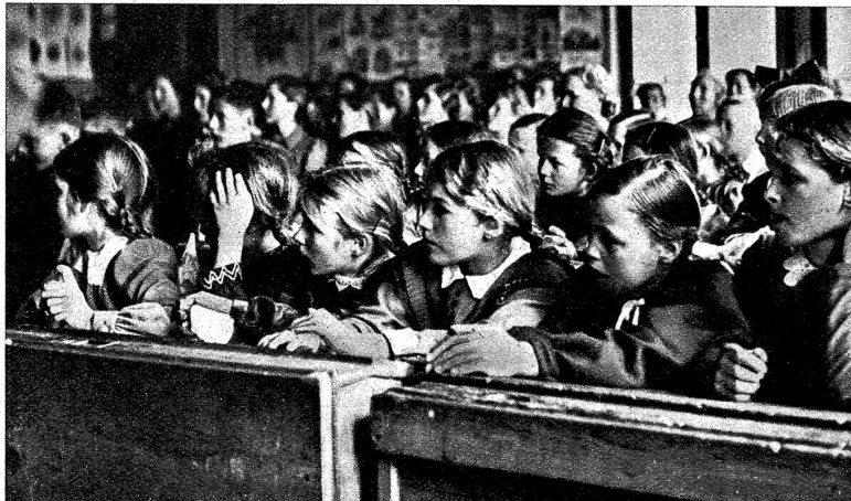
Examenstag im Kandertal. Dichtgedrängt sitzen die 3 Klassen an diesem Tag in einem Zimmer zusammen

Rechts: Von den Mitgliedern der Schulkommission wird der Examenbatzen gespendet