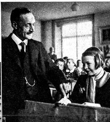
Rechts: Der Herr Lehrer stiftet jedem Kind eine Tasse Kaffee. Dazu werden Lebkuchen und Chrömlli gegessen, die man an diesem Tag vor dem Schulhaus kaufen kann

Unten: Vor dem Schulhaus wartet die Gutzlifu, bis die Kinder in der Pause Naschereien kaufen. Für die Jugend gehört der Kauf von Lebkuchen zum Schönsten an diesem Examenstag