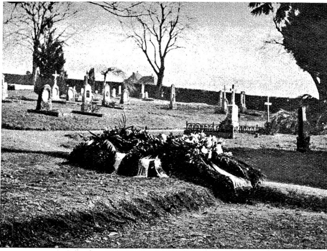
Die letzte Ruhestätte der amerikanischen Flieger. Auf dem Friedhof von Münsingen errichtet die amerikanische Gesandtschaft eine zentrale Ruhestätte für die in unserem Lande ums Leben gekommenen amerikanischen Flieger. In den Tagen vor Ostern wurde der erste USA-Pilot in Münsingen zur letzten Ruhe gebettet. Unser Bild zeigt den neu aufgeworfenen Grabhügel