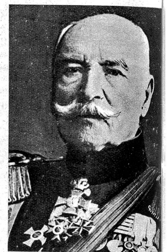
Rechts: Ein einzigartiges Jubiläum konnte dieser Tage in München der 103jährige General der Artillerie, Theodor von Bomhard, begehen. Am 6. April waren 85 Jahre verflossen seit seinem Eintritt als Leutnant in die alte bayerische Armee. Seit dem Jahre 1893, also über 50 Jahre, steht er im Generalsrang. Zusammen mit dem heute 94jährigen Generalfeldmarschall von Mackensen ist er der letzte Augenzeuge der Kaiserproklamation in Versailles, wohin er als Auszeichnung für besondere Tapferkeit im Kriege 1870/71 abkommandiert wurde. Der Jubilar ist nicht nur der älteste General der Welt, sondern auch der älteste lebende Träger des Eisernen Kreuzes