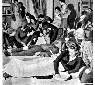
Die Luftschutzsanität hat die Verletzten und Verwundeten geborgen und bringt sie in die Sanitätsstelle der „Fürsorge“. Hier erhalten diese Verwundeten die erste Hilfe

(Zensur-Nummern: III Ad 1898, 1899, 1901, 1904, 1905, 1906)