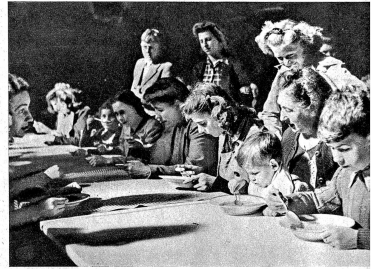
In einem hierzu bestimmten Saal erhalten diese „Ausgebombten“ ihre Mahlzeiten

Am nächsten Tag, als Patrice schon etwas eingelebt war, ging er hinunter nach Aix und spielte dort seine Partie Bridge, nachdem er den Vormittag den Kindern gewidmet hatte. Er begleitete sie zum Strand hinunter, wo gewöhnlich auch Martine und Bruno Lautier zu finden waren. Sylvain und seine Schwiegermutter gebrauchten die Kur. Nach dem Bade legte man sich in den heissen Sand oder man setzte sich unter einen grossen Sonnenschirm. Martine gab sich grosse Mühe um Bruno, der ihr gefiel. Er aber amüsierte sich darüber und versäumte nicht, Geneviève den Hof zu machen. Die Kinder kamen und liessen es nie zu einer