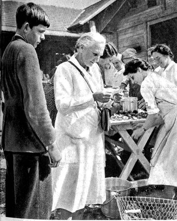
Soeben überbringt ein Meldeläufer die Meldung. „Über vierhundert Personen seien zu verpflegen“

„Gut, gehen wir.“ Jetzt wurde der Junge lebendig. „Oh, wenn du wüsstest, Papa, wie fein es hier ist!“