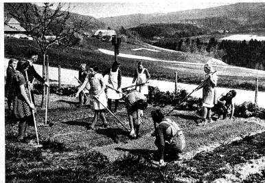
Die Schulgartenarbeit wird stets mit grosser Freude besorgt Zem.-Nr. 888 S. 10. 39.