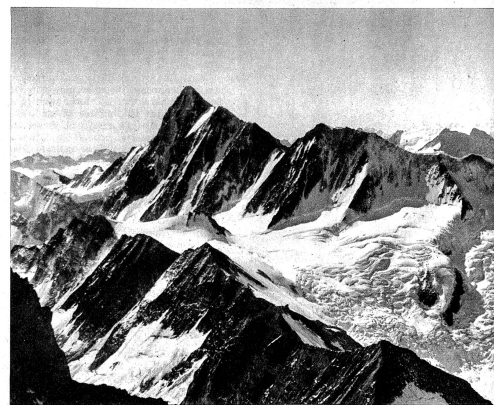
Das Finsteraarhorn vom Schreckhorn aus gesehen