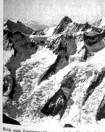
Blick vom Finsteraarhorn auf die Fischerhörner, Aletschhorn und Gross-Grünhorn