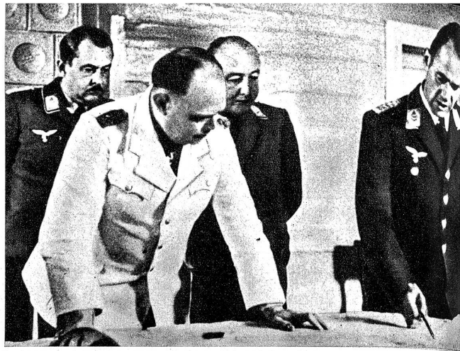
Über den Kartentisch gebeugt, verfolgt Feldmarschall Albert Kesselring in seinem Hauptquartier den Vortrag des Verbindungsoffiziers zwischen Heer und Luftwaffe

Links: Immer wieder übernahm Kesselring persönlich die Leitung des Fronteinsatzes. Durch die Unterstützung von Rommels Afrikakorps durch die Geschwader Kesselrings gelang es den deutschen Truppen bis an die Tere Alexandriens vorzustoßen. Marschall Kesselring in der Cyrenaika im Gespräch mit Rommels Stabsoffizieren