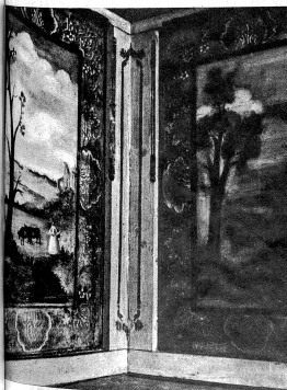
Die grosse Stube mit den vielen kleinen Fensterchen ist ringsum mit Bildern bemalt, welche ein durchreisender Künstler, Antony Schwallier, im Jahre 1760 im Auftrage des Hausherrn ausführte