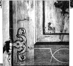
Auch diese eingelegte Türe mit dem alten schmiedeeisernen Träger stammt aus dem Jahre 1756 und befindet sich in der grossen Stube