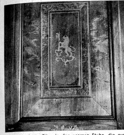
Schöne eingelegte Türe in der grossen Stube, die aus der Bauzeit des Hauses stammt