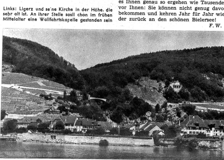
Blick vom Schiff auf das linke Seeufer und die Twannschlucht

Links: Gemütliches Lager- und Badeleben ist vor allem am rechten Ufer des Bielersees und auf der St. Petersinsel zu finden