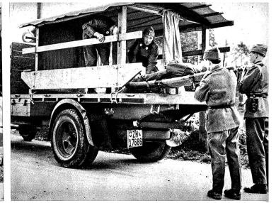
Rotkreuz-Kolonnen wurden organisiert und in beträchtlichem Mass ausgerüstet und die Mannschaft für Dienstleistungen ausgebildet. (III Lg 9137, III Lg 9138)