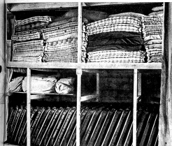
Das Schweiz. Rote Kreuz braucht beständig neues Material, es wird ständig ergänzt und vermehrt werden, wie zum Beispiel hier, zusammenlegbare Tragbahnen, Wäsche. (III Lg 9139)