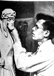
Der Sohn, ebenfalls ein begabter Künstler, scheint das Talent vom Vater geerbt zu haben. Er, wie auch sein Vater, haben früher viel im Ausland gearbeitet