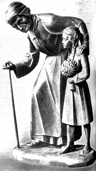
Mutter und Kind, eine der packenden lebensvollen Arbeiten, dem Meister eigen sind