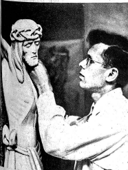
Der Sohn, ebenfalls ein begabter Künstler, scheint das Talent vom Vater geerbt zu haben. Er, wie auch sein Vater, haben früher viel im Ausland gearbeitet