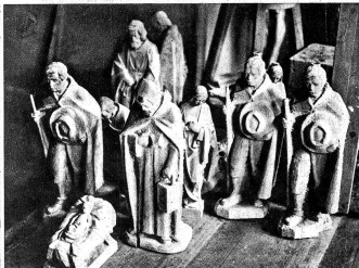
Zahlreich sind die im Atelier herumstehenden, teilweise noch unfertigen Holzplastiken, die unter den Händen des Meisters zu Kunstwerken von bleibendem Werte geschaffen werden