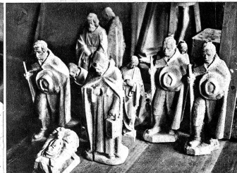
Zahlreich sind die im Atelier herumstehenden, teilweise noch unfertigen Holzplastiken, die unter den Händen des Meisters zu Kunstwerken von bleibendem Werte geschaffen werden