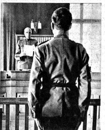
Das Urteil ist gefunden. In guter Haltung nimmt es der Angeklagte entgegen. Er ist Soldat. Er hört auch auf die ermahnenden und aufrichtigen Worte des Grossrichters, die ihn auf den richtigen Weg zurückweisen.