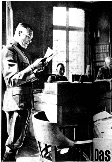
Die Verhandlungen, welche vom Grossrichter, einem Justizoffizier, präsident werden, sind eröffnet. Der Gerichtsschreiber, ebenfalls ein Justizoffizier, verliest die vom Ankläger verfasste Anklageschrift. Sie umschreibt in kurzen Zügen die dem Angeklagten zur Last gelegte Tat und bildet die Grundlage der weiteren Verhandlung.