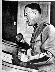
Der Verteidiger hat das Wort. Bezeichnet der Angeklagte selbst keinen Verteidiger, so ernennt der Grossrichter einen solchen. Jeder rechtskundige Offizier der Division ist verpflichtet, die Verteidigung zu übernehmen.

Obwohl die Verhandlungen der Militärgerichte in der Regel öffentlich sind, dringt eigentlich sehr wenig über die Tätigkeit dieser Gerichte an die Öffentlichkeit, so dass vielfach unter der Zivilbevölkerung — und zum Teil unter den Soldaten selbst — oft eine ganz falsche Vorstellung über die Zusammensetzung und Arbeitsweise dieser Gerichte vorhanden sind. Auch hier, wie bei