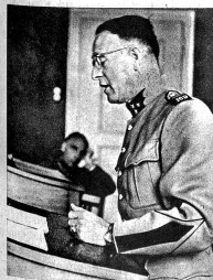
Der Verteidiger hat das Wort. Bezeichnet der Angeklagte selbst keinen Verteidiger, so ernennt der Grossrichter einen solchen. Jeder rechtskundige Offizier der Division ist verpflichtet, die Verteidigung zu übernehmen.

Obwohl die Verhandlungen der Militärgerichte in der Regel öffentlich sind, dringt eigentlich sehr wenig über die Tätigkeit dieser Gerichte an die Öffentlichkeit, so dass vielfach unter der Zivilbevölkerung — und zum Teil unter den Soldaten selbst — oft eine ganz falsche Vorstellung über die Zusammensetzung und Arbeitsweise dieser Gerichte vorhanden sind. Auch hier, wie bei