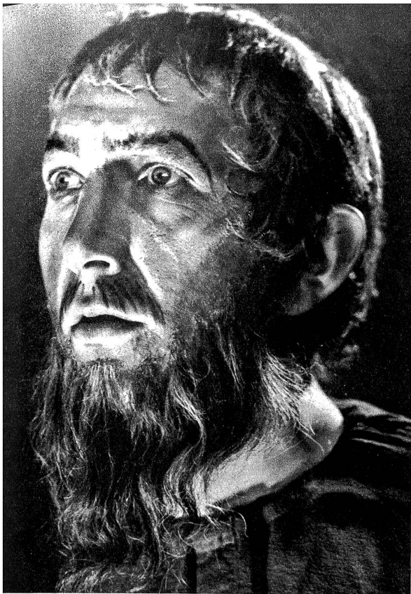
Chlaus vo Flüe