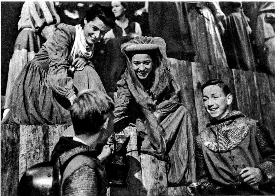
Volksfest zum Empfang der Sieger von Nancy