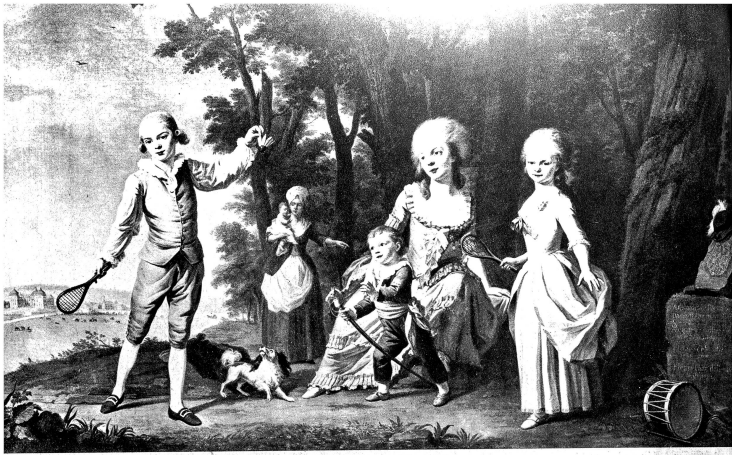
Prinzessin Louise de Buffremont und ihre Kinder, gemalen von J. N. Wyrch (Eigentum der Bernhard Eglin-Stiftung des Kunstmuseums Luzern)

Wenige Schweizerstädte verfügen über eine derart alte Ausstellungstradition wie Luzern. Wenn anderswo auch gelegentlich, besonders im Zusammenhang mit der Anlage der ersten öffentlichen Bibliotheken, die lokalen Sammlungen in der Form von «Kunstkabinetten» weiter zurückreichen, darf doch die Reudstadt den Ruhm für sich in Anspruch nehmen, eine der ältesten Kunstgesellschaften zu besitzen, die sich schon früh auch die Pflege von temporären Ausstellungen angelegen sein liess. Die Anfänge reichen bis in die Zeit der Restauration zurück; 1817 wurde von Schultheiss Vinzenz von Rüttimann, dem «Landammann der Schweiz» der Mediationszeit, in romantisches Gestirn eine «Grosse Gesellschaft» von Freunden der Künste und Wissenschaften gegründet, die wohl in der Art einer Akademie gedacht war. Eine ihrer Unterabteilungen nannte sich «plastische Sektion» und umfasste die bildenden Künste. Ihrem zielbewussten ersten Präsidenten, dem Initiator des Löwendenkmals, Oberst Karl Pfyster von Altshofen, hat sie es wohl in erster Linie zu danken, wenn sie unter dem Namen «Kunstiergesellschaft» flott in die folgenden Jahrzehnte hineinsagelte und damit als einzige Sektion der zu weit geplanten Gesamtvereinigung ihre Lebensfähigkeit unter Beweis stellte.