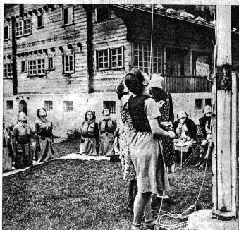
Jeden Morgen versammeln sich alle Pfad. um den Fahnenmast. Die nicht gehen können, werden getragen, die Blinden werden von ihren Führerinnen geführt. Aus allen Gesichtern strahlt tiefe Freude, beim Hochziehen unserer Schweizerfahne. Schon das Leben in der freien Natur, die be-