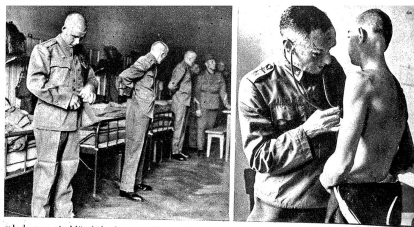
«Jede vor sie Nacht!» hat der Korporal gerufen und jetzt kontrolliert er die Hosenlängen, Schnalle mehr anziehen — Höher diese Hosen, und jene tiefer. Es ist alles nach sehr gabig am ersten Tag, die Rekruten und das viele Zeug aus Tuch und Leder, das sie fortan zu tragen und zu pflegen haben Zens. Nr. 16381